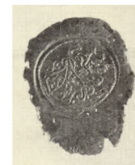
odtlačok osobnej pečiatky J. Hollého